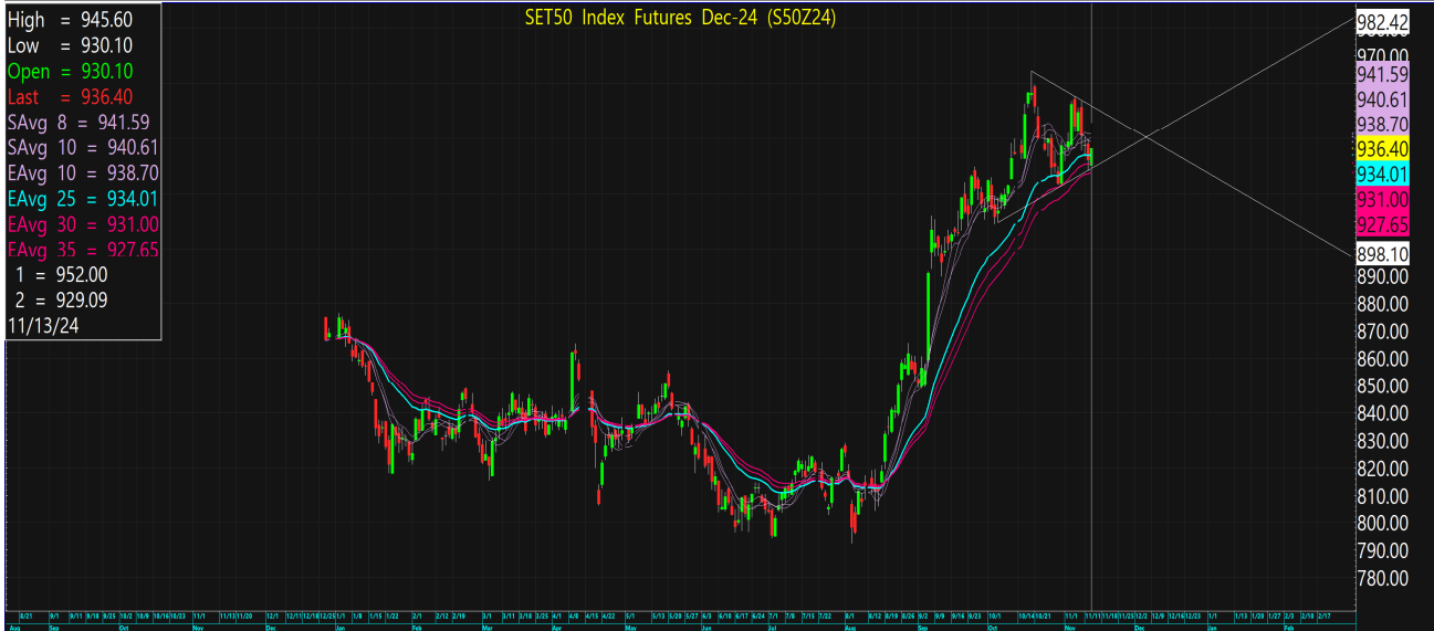
SET50 Index Futures Dec-24 (S50Z24)

กลยุทธ์: ปิดได้เส้น 10 วันที่ 938-940 ต่อจึงทำให้หน้าสั้นยังคงเป็นฝ่ายได้เปรียบต่อในช่วงสั้นๆจนกว่าจะขึ้นมาปิดเหนือ 941 ใหม่ตั้งนั้นจึง ขอสวางแผนการเล่นตามหน้างานที่เกิดขึ้นดังนั้นก็กล่าวคือหากซิ่งดั้งขึ้นมาก่อนก็ให้ไป OPEN SHORT แถวๆแนวต้านที่ให้ไว้แล้วรอปิดทำกำไร ตอนอ่อนตัวกลับลงมาในระหว่างวันโดยกำหนดจุดตัดขาดทุนหรือ CUT LOSS เมื่อขาดทุนเกิน 5 Points เพื่อทำ Risk-Control หรือเมื่อ S50Z24 ปิดเหนือ 946 แต่ในทางกลับกันหากเกิดการย่อตัวลงมาก่อนก็ให้ไป bet เปิด LONG แถวๆแนวรับที่ให้ไว้แล้วรอขายทำกำไรตอนดีดกลับขึ้นมาใน ระหว่างวันแต่ก็ควรวาง Trading stop ด้วยนะหากราคาออกจากต้นทุนเกิน 5 Points หรือเมื่อ S50Z24 ลงมาปิดต่ำกว่า 926