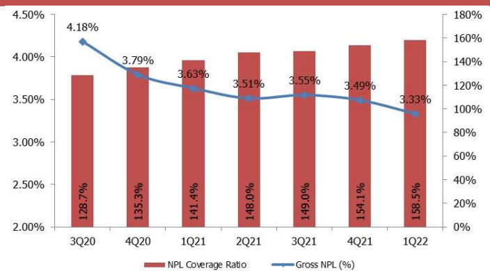
CHART 2: NPL coverage ratio and gross NPLs

บริษัทหลักทรัพย์ ทรินิตี้ จำกัด, 179 อาคารบางกอก ซิตี้ ทาวเวอร์ ชั้น 25-26, 29 ถนนสาทรใต้ เขตสาทร กรุงเทพฯ 10120 โทรศัพท์ 0-2088-9100 โทรสาร 0-2088-9399